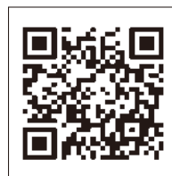
滋賀試験会場 (B日程のみ)